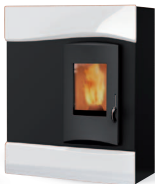
ceramica bianco panna